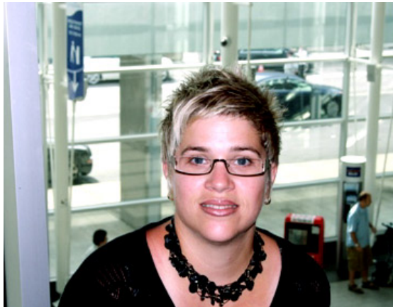
À l'aéroport en quittant le Québec

“Je suis bien contente d'avoir pris la décision de subir l'opération et de suivre le traitement à Cuba. Les soins sont extraordinaires et le personnel est remarquable. C'est maintenant à moi de suivre les recommandations de mon médecin. Nous pouvons maintenant espérer voir une lumière au bout du tunnel. N'hésitez plus!”