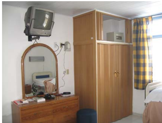
La chambre où j'ai séjourné avec ma mère pendant 21 jours

Le jour de l'opération : le 30 juin 2009. Levée à 6h du matin. J'étais un peu nerveuse, mais confiante.