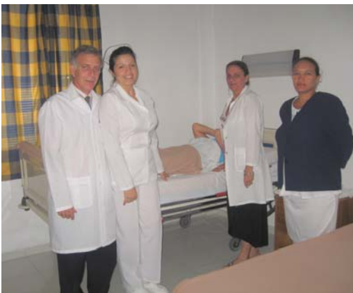
La même journée, visite du chirurgien et de son équipe pour l'enlèvement du bandage. C'est un grand jour !