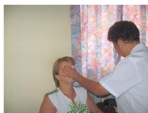
Tous les matins, je recevais des traitements d'électrostimulation. Ce n'est pas douloureux. On contrôle soi-même la force de l'électricité.